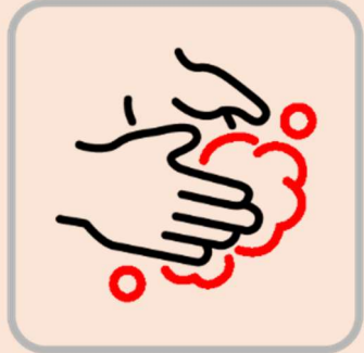
手洗いのご協力をお願いします Please wash hands whenever possible