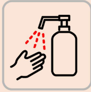
アルコール消毒にご協力ください Please make sure to conduct alcohol disinfection