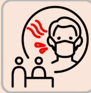
体調不良時はお申し出ください Please inform us when you feel unwell