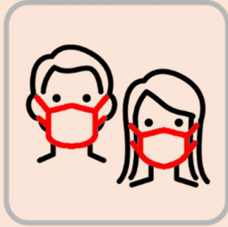
マスク着用にご協力ください Please make sure to wear face masks