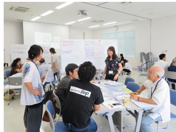
宜野湾市地域コーディネーター養成講座ぎのわん地域づくり塾3期目