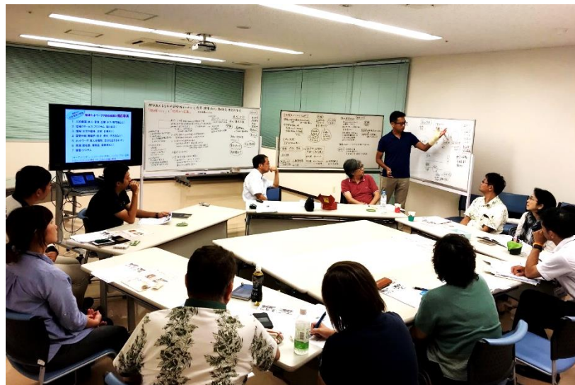
<会員・理事向け>勉強会・意見交換会を開催 「地域づくり」と「地域ケア会議」