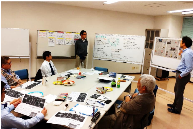
会員交えての拡大理事会(天久ヒルトップにて)