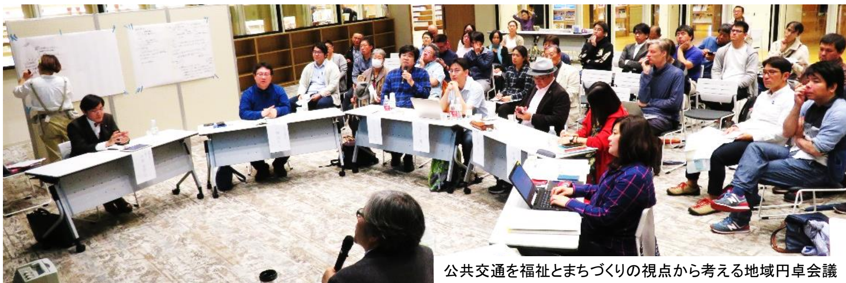
公共交通を福祉とまちづくりの視点から考える地域円卓会議