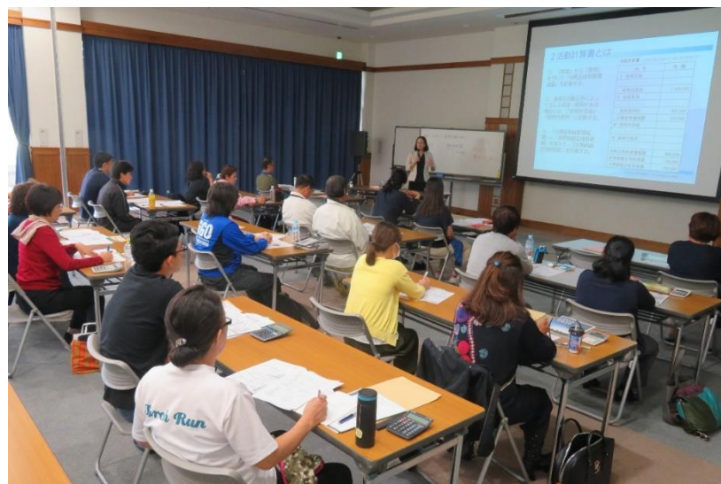
NPO法人会計基準講座&税理士個別相談会(in うるま市、那覇市、宮古島市(主催:沖縄県))