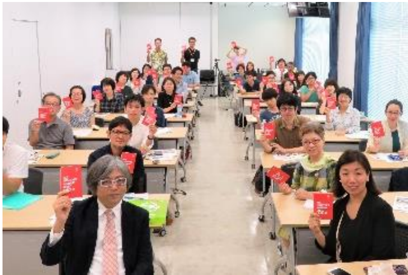
沖縄地域社会ビジョン大学院2018