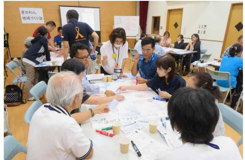
宜野湾市地域コーディネーター養成講座 ぎのわん地域づくり塾2018(モデル地区:上大謝名自治会)