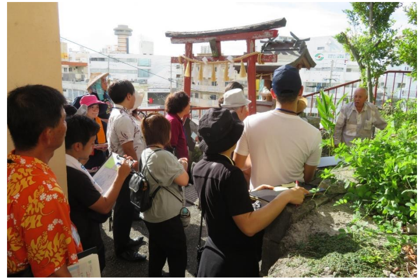
なは市民協働大学院の企画・運営をNPO法人1万人井戸端会議と共同運営