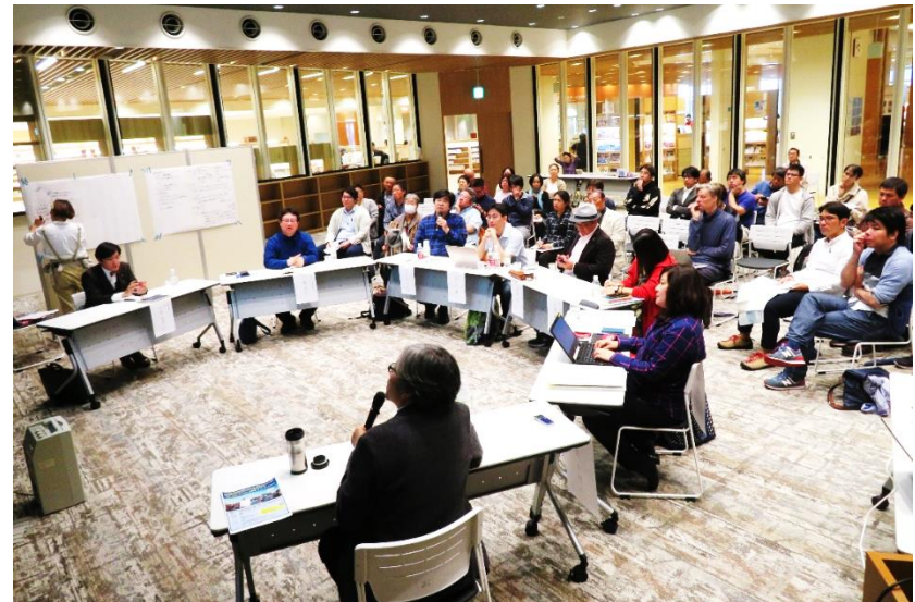
公共交通を福祉とまちづくりの視点から考える地域円卓会議