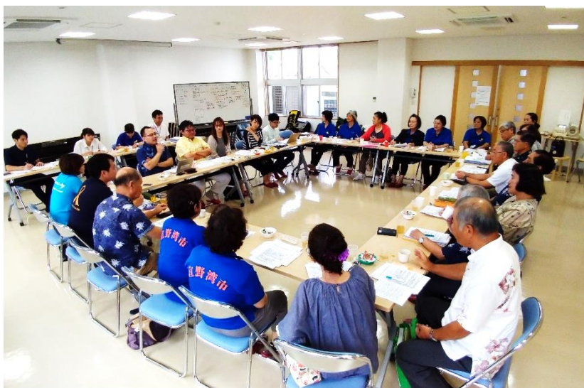
沖縄県民生委員活動活性化事業。宜野湾市真志喜中校区民児協(第2回モデル地区会議)