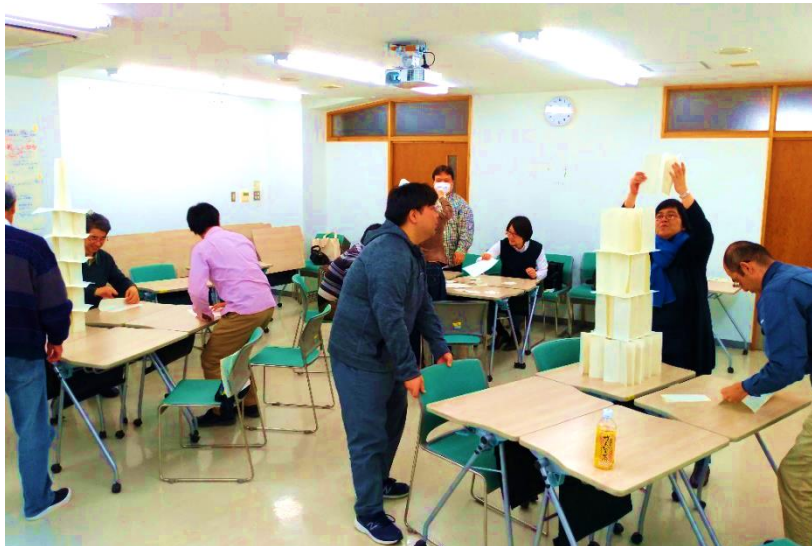
新入生オリエンテーションプログラムづくり研修 沖縄大学法経学部