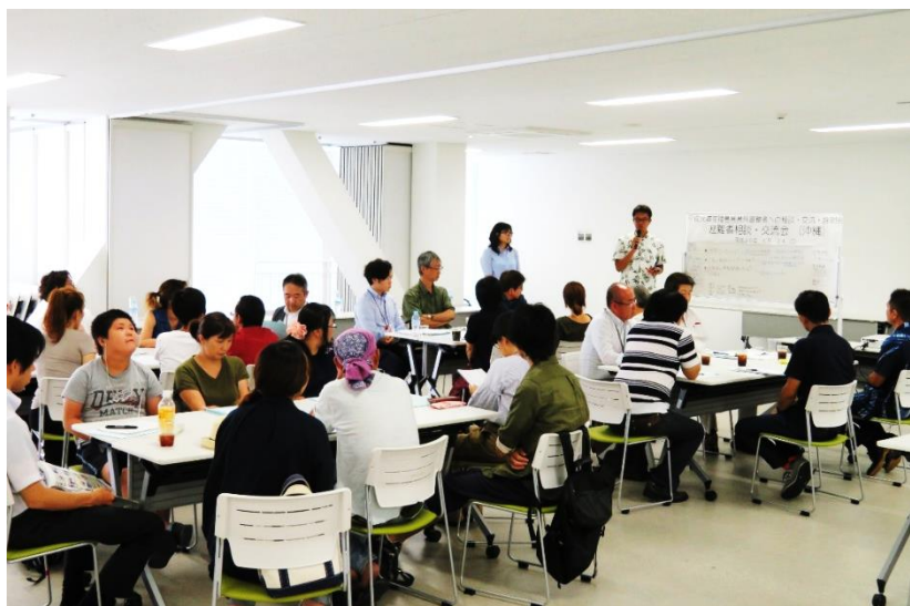
福島県県外避難者への相談・交流・説明会事業 避難者相談・交流会<沖縄>