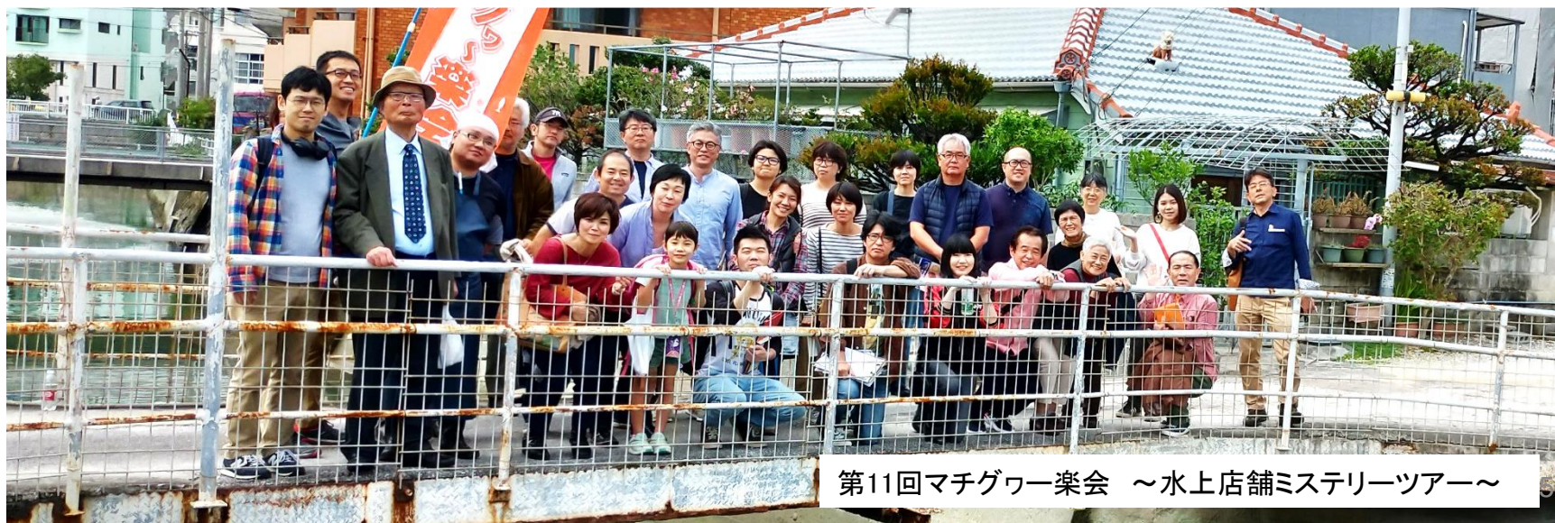
第11回マチグワー楽会 ～水上店舗ミステリーツアー～