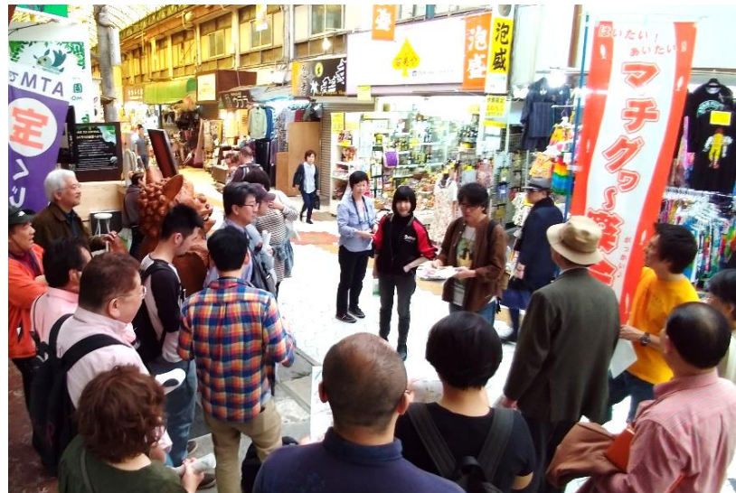
第11回マチグラー楽会。水上店舗ミステリーツアー『入れ子の水は月に轆かれ』～著者とともに歩く～