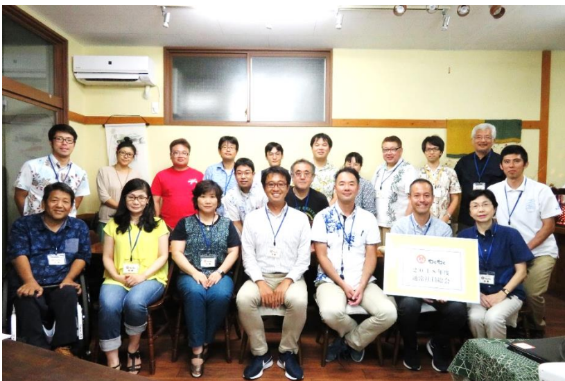
通常社員総会(「てる屋」にて)