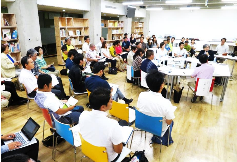
子どもの貧困対策に向けた3回の円卓会議 (主催: 沖縄子どもの未来県民会議)