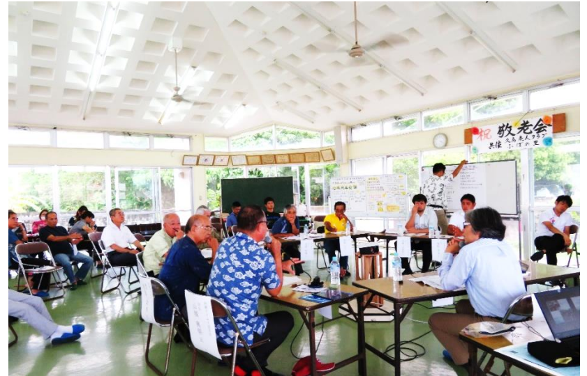
久高島へのUターンを考える地域円卓会議