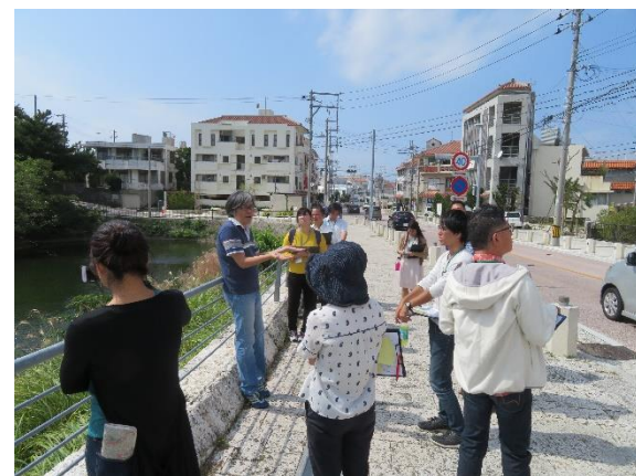
なは市民活動支援センター講座