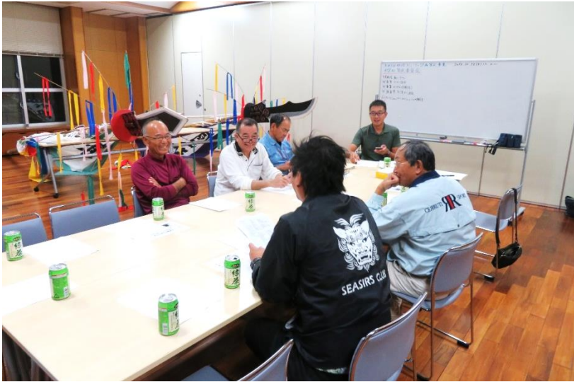
南城市津波古区・地域コミュニティ計画策定事業